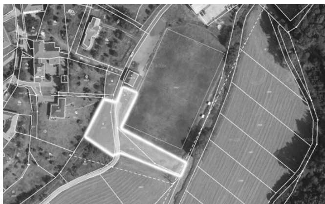
Obrázek 1: Parcely pro realizaci projektu